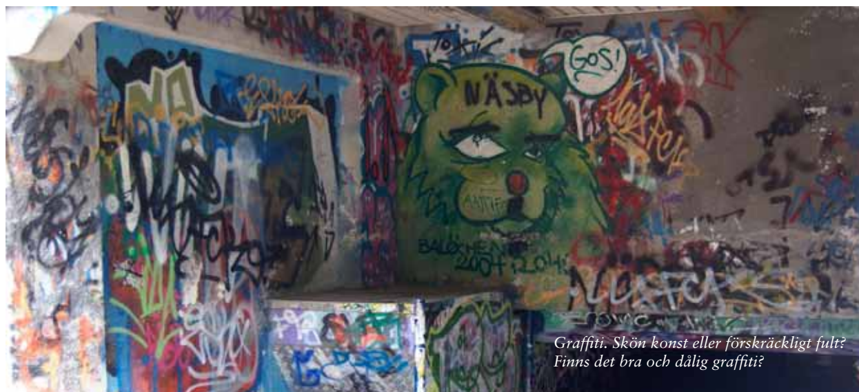
Graffiti. Skön konst eller förskräckligt fult? Finns det bra och dålig graffiti?

Det finns alltså inte en rätt smak, det sköna är inte en enda sanning (som under antiken), utan något som är upp till var och en. Det är alltid du som bestämmer vad som är snyggt eller vackert.