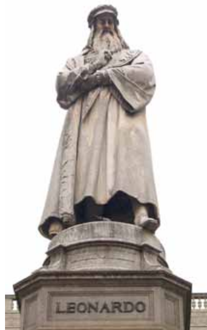
Leonardo da Vinci förkroppsligar renässansens ideal om den allvetande. Han arbetade både med måleri, skulptur och uppfinningar. Han förenade konst, form och teknik.

Den funktionella kvaliteten hör därför ofta ihop med den estetiska. Det är inte bara för miljöns skull vi köper en miljöbil, det kan också vara för att visa oss miljömedvetna.